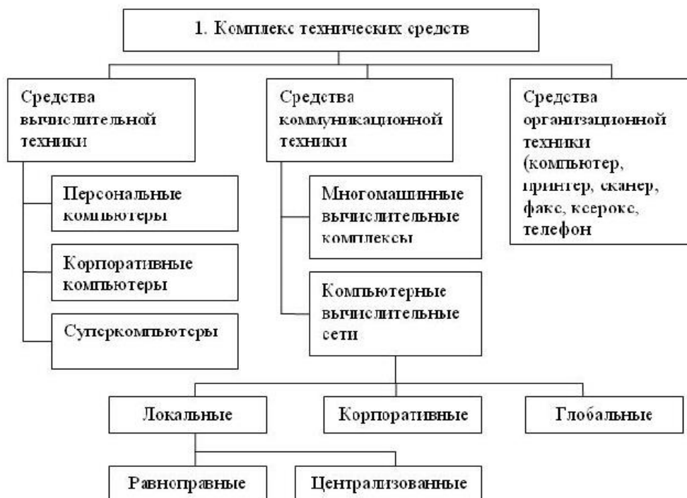
Рисунок 1 - Структура комплекса технических средств АИТ