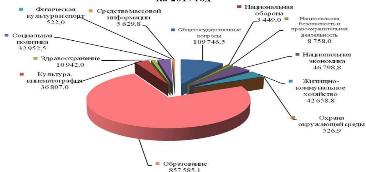
Рисунок 1 - Структура расходов бюджета городского округа на 2017 год, в %

Таблицы применяют для лучшей наглядности и удобства сравнения показателей и оформляют в соответствии со следующими требованиями: название таблицы должно отражать ее содержание, быть точным, кратким и помещаться над таблицей; таблицы, за исключением таблиц приложений, следует нумеровать арабскими цифрами сквозной нумерацией.