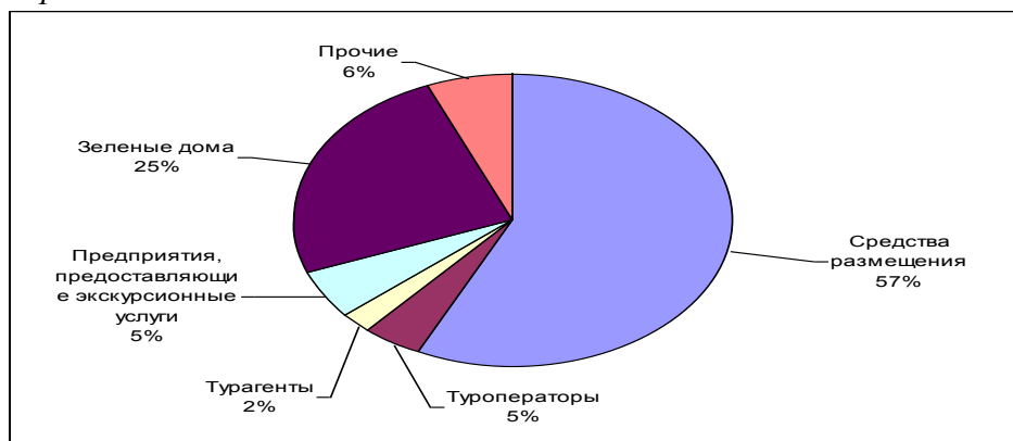
Рисунок 1 - Структура туристских предприятий Республики Алтай по видам деятельности в 2019 году, в %

Таблицы применяют для лучшей наглядности и удобства сравнения показателей и оформляют в соответствии со следующими требованиями: название таблицы должно отражать ее содержание, быть точным, кратким и помещаться над таблицей; таблицы, за исключением таблиц приложений, следует нумеровать арабскими цифрами сквозной нумерацией.